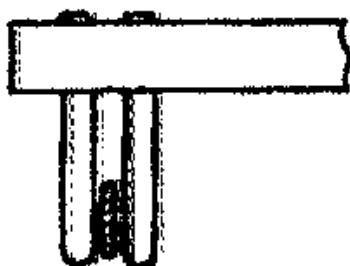
Rys. Z.4. Zamek włosu bregetowskiego

Końcowe urządzenie przesuwki, utrzymujące włos. Zamek włosu bregetowskiego składa się z dwóch jednakowych kołków (rys. Z.4.), a zamek